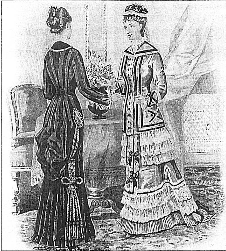
Lámina con la última moda del año 1.878. ARCHIVO BALNEARIO